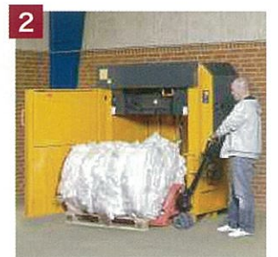
2. 簡単なボールの取り扱い