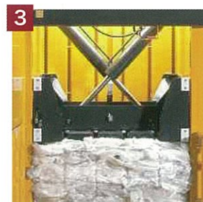
3. クロスシリンダーの採用