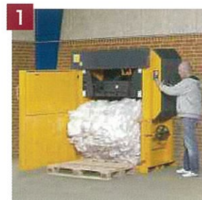
1. ボタン操作で梱包物排出